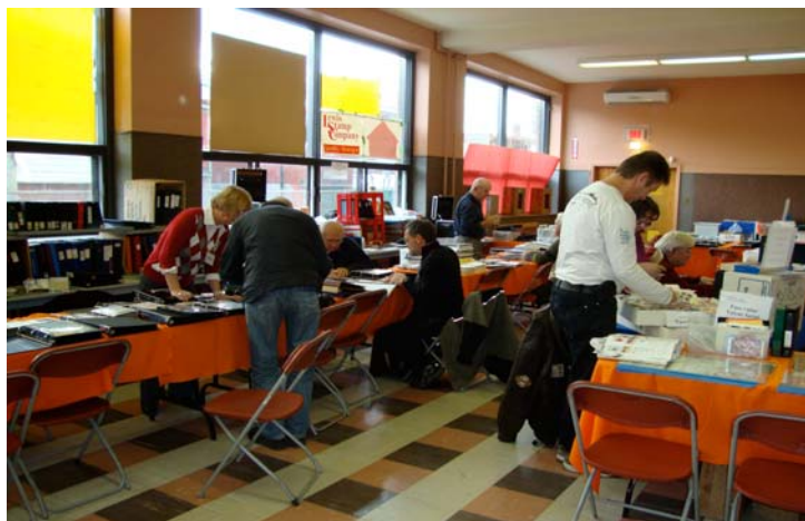
Voici le résultat des expositions d'Exup 31 - 2012: