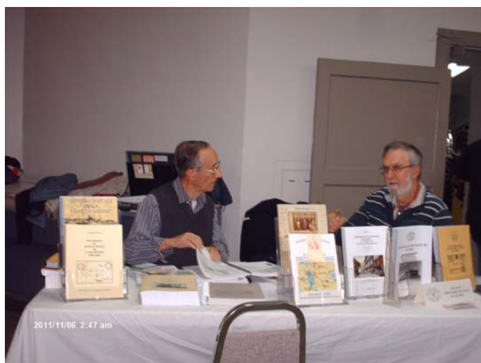
La Société d'histoire postale du Québec