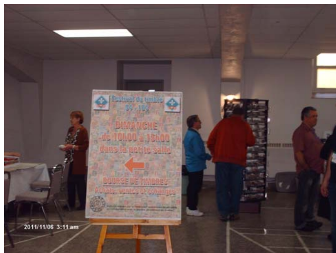
La bourse des timbres