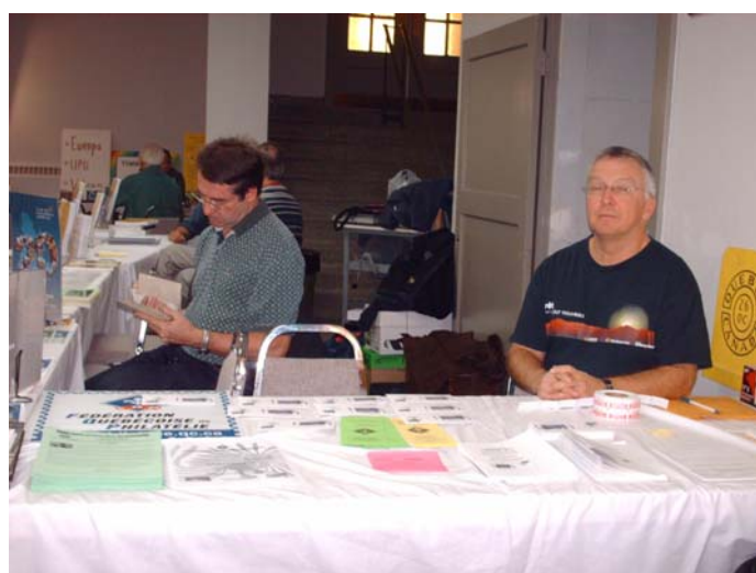
La table de la Société philatélique de Québec et de la Fédération québécoise de philatélie