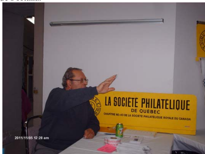
La table d'accueil